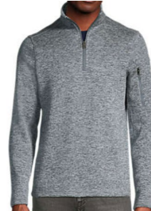
Quarterzip or Fullzip Colors: Gray