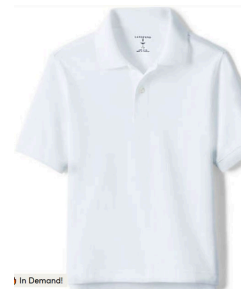
Polo w/ ICA Logo (Long or Short sleeve) Colors: Hunter green, gray, & white