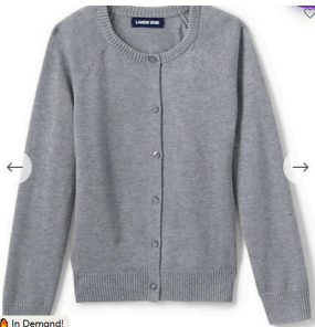
Cardigan sweater (Zip or Buttondown) Colors: Hunter green, gray, navy, & white