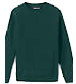
Sweatshirt Colors: Hunter green & gray