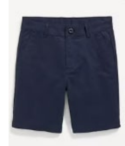
Navy or Khaki Chino Pants or Shorts