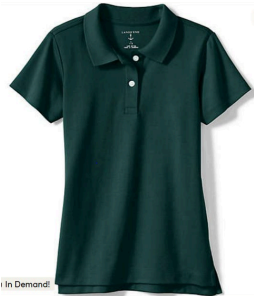
Polo w/ ICA Logo (Long or Short sleeve) Colors: Hunter green, gray, & white