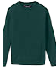
Sweatshirt Colors: Hunter green & gray